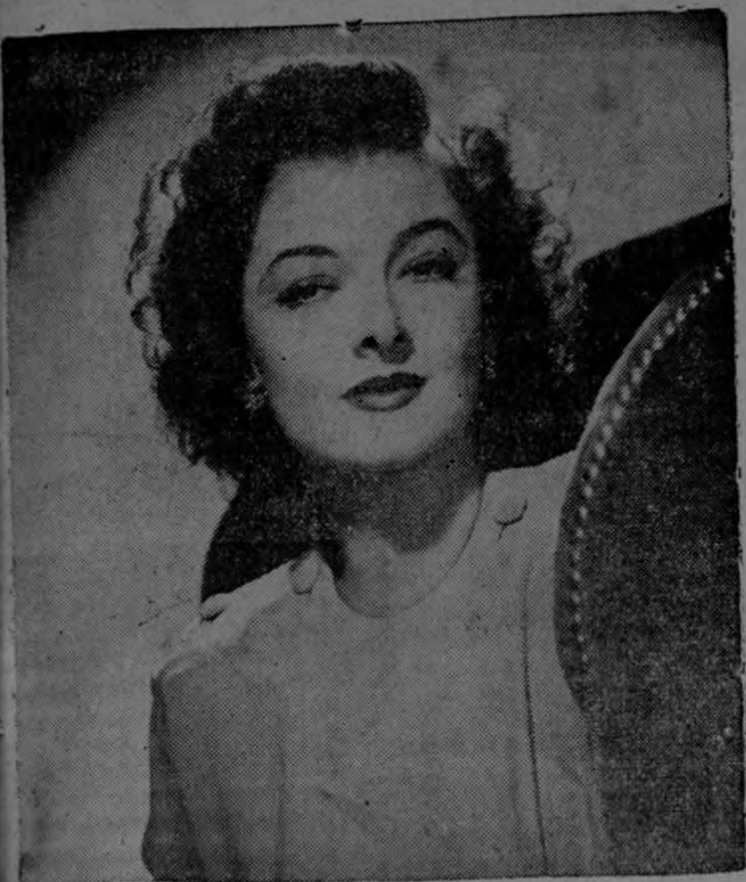
MYRNA LOY, encantadora estrella de los Estudios Metro-Goldwyn-Mayer, a quien pronto veremos en una nueva película, con William Powell.