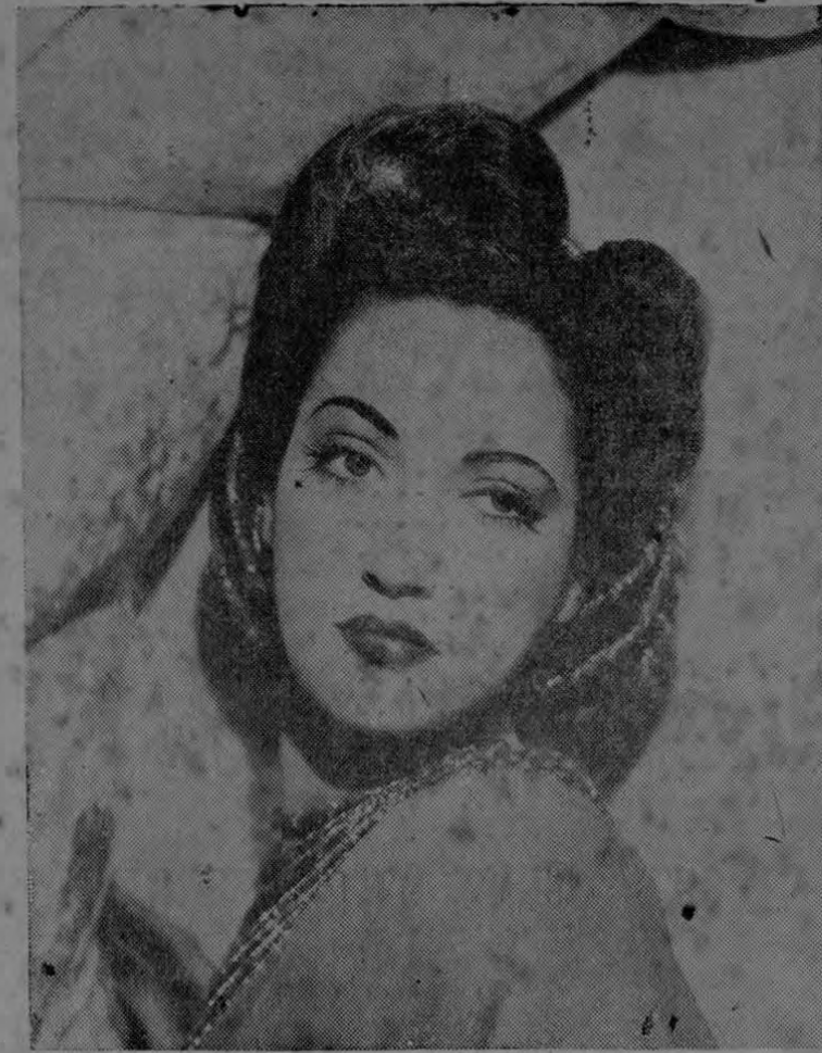
El consultor de belleza de las estrellas de Hollywood Max Factor Jr., cita a la linda actriz DOROTHEA LAMOUR, del Studio Paramount, como

Hoy en día puede decirse que ninguna mujer que tiene pecas se siente por ello menos atractiva ni menos bonita. Para de día, ninguna se preocupa de disimularlas siquiera —y para salir de noche, basta con aplicar el nuevo y moderno maquillaje "pancake" en un tono suficientemente subido para neutralizar el color de la piel que presente pecas. Las pecas, para la mujer moderna, han dejado de ser un difícil problema de